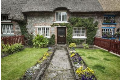
Adare Thatched Cottage