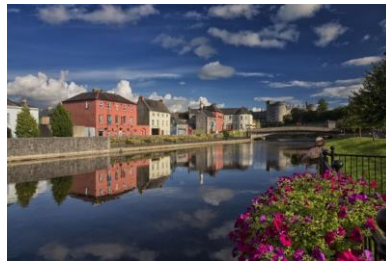
Kilkenny Town River