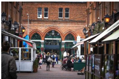
Dublin, Georges Street Arcade