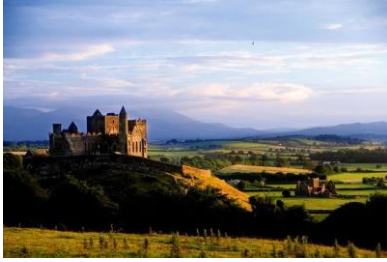
Rock of Cashel, Co. Tipperary