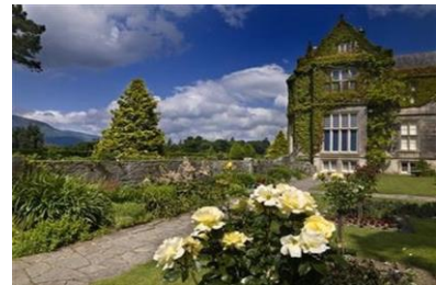
Killarney Muckcross House