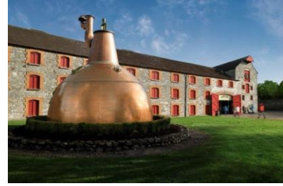
Jameson Distillery Middleton