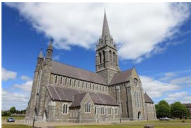
St. Mary`s Cathedral, Killarney