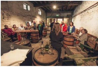
Kilbeggan Whiskey, Co. Westmeath