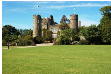
Dublin, Malahide Castle