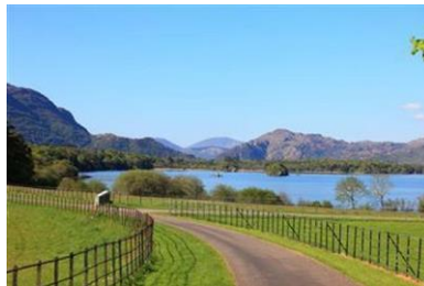
Lakes of Killarney