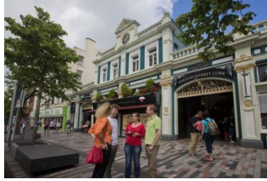
English Market cork